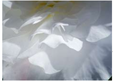
KUVA: SINIKKA MÄKIVIERIKKO

Nöyrtyminen on vaikeaa itsekkäälle ihmiselle, mutta Jumalalla on keinot luonnettamme muuttamiseen. Sairaus ja kärsimys on yksi tapa. ”Rakkaani, älkää oudoksuko sitä hellettä, jossa olette ja joka on teille koetukseksi, ikäänkuin teille tapahtuisi jotakin outoa, vaan iloitkaa, sitä myöten kuin olette osallisia Kristuksen kärsimyksistä, että te myös hänen kirkkautensa ilmestyessä saisitte