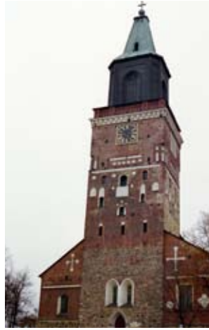
KUVA: SINIKKA MARKKINIKKO

Topelius: Boken om vårt land Internet, Google-hakus. Agricola, mm. Elina Maines: ”Agricolan historia”; Video Agricola-juhluvuoden pääjuhlasta Turussa 9.4.2007