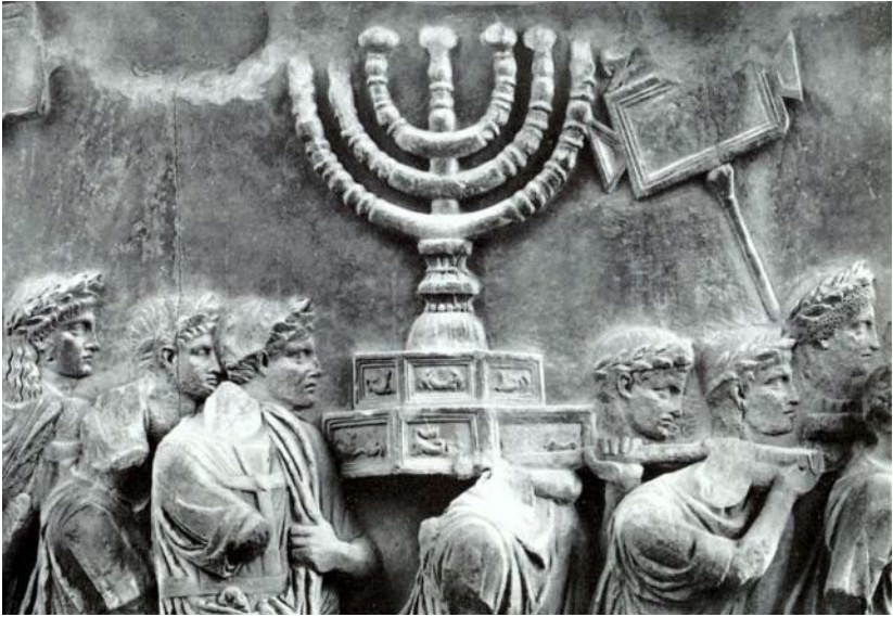
Vuonna 71 sodasta Roomaan palaavan Tituksen voittokulkueessa oli 700 juutalaista vankia ja kaksi kallisarvoista kultaesineitä: seitsenhaarainen kynttilänjalka ja näkyleipäpöytä Jerusalemin temppelistä.

roomalaiset pääsivät tunkeutumaan sisäpihalle ja puisille temppelin porteille. Titus komensi sytyttämään portit tuleen. Porttien tuhouduttua roomalaiset pääsivät sisään ja verinen lähitaistelu alkoi.