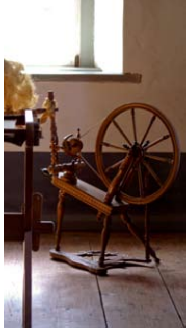
KUVA: S. MÄKIVIERIKKO

– Lähde: Suomen Kuvalehti, nettiversio 21.9.2008