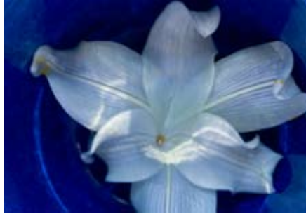
KUVA: S. MÄKVERIKKO

Jeesus Kristus, sinä, jonka kädessä on kansojen ja yksilöiden kothalo, haluamme tuoda suuren kiitoksen siitä, että olet suojellut ja varjellut Suomen kansaa. Tällä hetkellä, kun maassa on rauha, rukoillemme, että kansa näkisi sinun armosi, sinun tekosi, niin että ei luotettaisi vain omaan viisauteen.