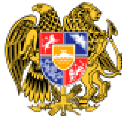
Armenian valtion vaakunassa on Ararat-vuori ja Nooan arkki.