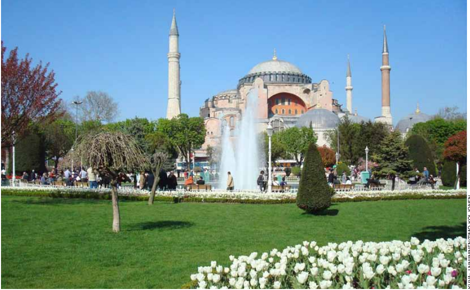
Hagia Sofia. Tässä 'Pyhän Sofian' kirkossa sulttaani Muhammed II Bujuk (Suuri) ylisti Allahia sotaonnestaan toukokuussa 1453. Samalla hän murskasi sen alttarin ja muutti kirkon moskeijaksi. Vuodesta 1934 lähtien Hagia Sofia on ollut museona.

taistuillemme 1451 sinetöi Konstantinopolin kohtalon. Hänen taitavat unkarilaiset insinöörit valoivat valtavan suuren kanuunan, joka ladattiin ruudilla ja suurilla kivikuulilla. Tämä lienee ensimmäinen kerta, kun piiritykseen käytettiin ruudilla ladattua tykistöä.