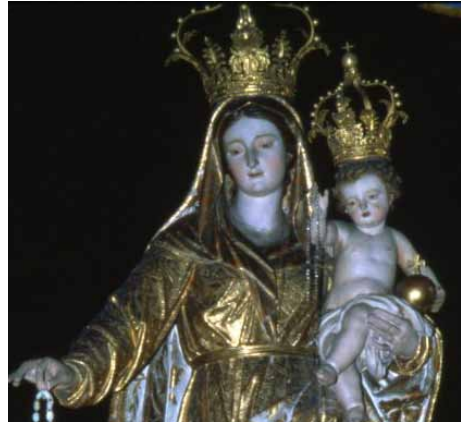
KUVA: MILANOL. KATEDRAALIISTA osi. 2003/SM

Virkekäsityksellä Lehman tarkoitta- nee useaan otteeseen mainitsemaansa ”apostolista seuraantoa” (piispojen suk- sessiota), jonka katolinen kirkko katsoo toteutuneen Rooman kirkossa apostoli Pietarista lähtien tähän päivään asti. Sik- si se pitää itseään ainoana varsinaisena kirkkona, josta muut ovat ”luopuneet”. Historiallisessa tilaisuudessa oli läsnä