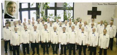
Kajaanin Mieslaulajat CD-esitteessään.