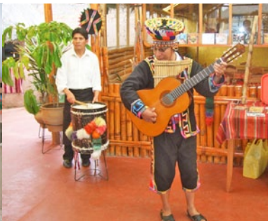
Buffet Andino -ravintola