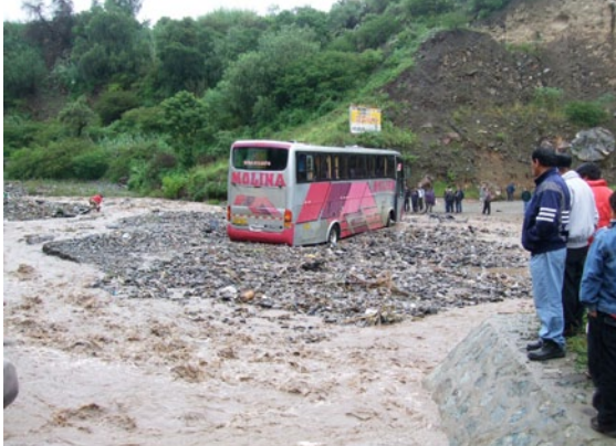
Bussi tulvan tielle tuomien kivien keskellä.

Aamulla linja-autoaseman laitureille ei päässyt, ennenkuin oli maksanut pienen asemamaksun. San Cristobal del