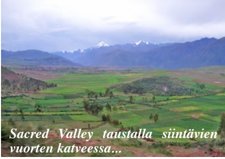
Sacred Valley taustalla siintävien vuorten katveessa...

Surin bussi oli vaatimatonta, paikallinen pikavuoro. Se tuli täyteen. Lähtö viivästyi vartin. Yritin kuvata vuoriston laamalaumoja, mutta se oli hankalaa. Osa oli ilmeisesti alpakoita. Niiden villa on hienompaa kuin laaman. Epämääräisessä ”puolimatkan krouvissa” pidetyn tauon jälkeen bussiin vaihdettiin takarengas vastapäisessä korjaamossa.