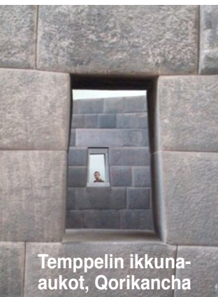
Tempppelin ikkuna- aukot, Qorikancha