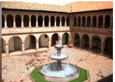
Museo Municipal de Arte Contemporáneo

Palattuani hotelliin kävi ilmi: Machu Picchuun ei pääse. Rata ei toimi. Toinen vaihtoehto, ajaminen parilla bussilla ja vaeltaminen Inka-reittiä (3-4 päivän matka), oli sekini nyt liian vaarallinen. Helikopterilla pääsisi vain läheiseen hotellikylään, rauniokaupunkiin ei mitenkään.