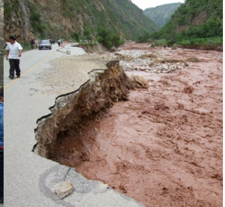
Tulvan runtelema tie ennen Cuscoa.