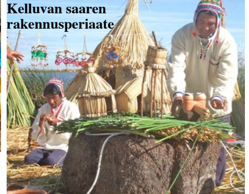
Kelluvan saaren rakennusperiaate

Maanantai-aamuna lähdin bussilla Bolivian puolelle Copacabanaan Titicaca-järven eteläosassa. Perun raja-asemalla sain leiman passiini ja toisen Bolivian puolella – käveltyäni ensin puoli kilo-