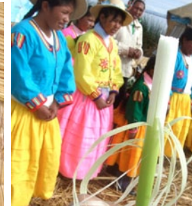
Syötävä rakennusaine: totora-kaisla