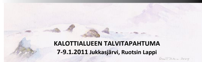
KALOTTIALUEEN TALVITAPAHTUMA 7-9.1.2011 Jukkasjärvi, Ruotsin Lappi