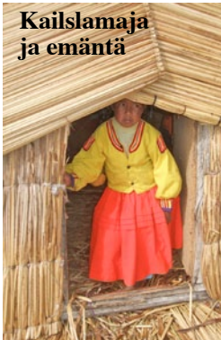
Kaislamaja ja emäntä