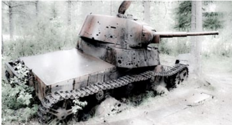
Talvisodan taipaleella uupunut tankki.