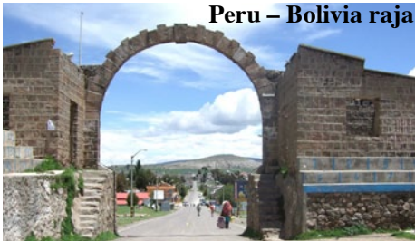
Peru – Bolivia raja

punkkia. Auringonpaiste oli polttava. Matka takaisin sujui mukavalla Tour Peru – Inca Class -bussilla. Rajalla jälleen passin leimaus ja kävely maita erot-tavan ”riemukaaren” alitse.