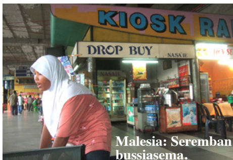
Malesia: Seremban bussiasema.

Ruokailu lentoaseman intialaisessa kasvisravintolassa aamuyön tunteina oli pettymys sikäli, että muuten hyvä ruoka oli liian voimakkaasti maustettua syötäväksi. Tuntien odottelun jälkeen tapahtui pieni sekaannus bussin valinnassa, pika-vuoron sijasta paikallisbussi, ja se vaikutti siihen, että nyt joutui vaihtamaan busssia ylimääräisen kerran. Mutta siitä tuli elämysmatka: bussin keskellä ollut rikkinäinen haitariovi retkotti auki hakaten rajussa ilmavirrassa bussin oviaukkoa vasten. Onneksi ulkoilma oli lämmin. Sen lisäksi bussin voimansiirrosta oli vikaa: kuului voimakas, toistuva, mekaaninen