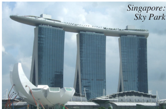
Singapore: Sky Park