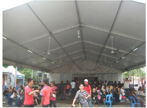
Kuala Lumpur. Bussiaseman odotustila.

ja, kaunis, puhdasilmäinen puistoalue. Siellä oli miellyttävää viettä viiden tunnin odotusaika kaaosmaisen bussiaseman sijasta.