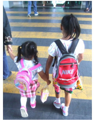
Pitkä kävely: Singaporen saarelle pääsy käy valtavan tulliaseman läpi.

Pääkaupungin nimi on myös Singapore, maaseutuakin löytyy saarelta, jolla tiet, maisemointi, kaikki oli asiallisesti ja tavattoman kauniisti tehty useimmissa paikoissa. Varmaankin siistein ja kaunein maa mitä olen nähnyt. Roskaamisesta siellä ei mene henki, mutta siitä voi saada tuntuvat sakot – sen sijaan huumeiden