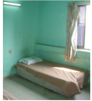
Hawaii-hotellin taso hirvitti.

ääni. Tuntui kuin olisi ollut mukana toimintaelokuvan pommikoneessa, joka kiittää halki pimeyden. Tuon kaottisen bussimatkan tuoman kokemuksen vuoksi kannatti hypätä väärään bussiin, varsinkin kun tuli parin vaihdon jälkeen onnellisesti perille Seremba'an. Sieltä matka jatkui Plusliner-bussilla.