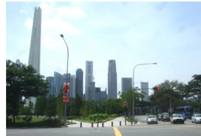
Singaporen liikepalatseja ja kauniita puistoalueita. Autoilijan ihannemaa – jalankulkijat ovat suurimmaksi osaksi maan alla. Liikenne vasemmanpuoleinen kuten Malesiassa ja Thaimaassakin.