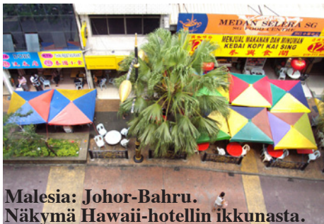
Malesia: Johor-Bahru. Näkymä Hawaii-hotellin ikkunasta.