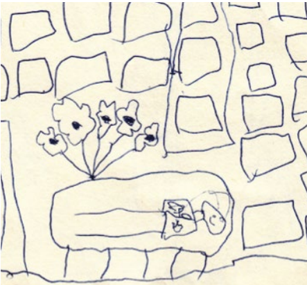
KUVA: ARAM MÄKIVIERIKKO, 5 v.

”Tämän katoavan on näet pukeuduttava katoamattomuuteen ja kuolevaisen kuolemattomuuteen” (1. Kor. 15: 37-44, 53). Milloin? ”Viimeisenä päivänä minä herätän hänet” (Joh. 6:40).