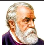
Dwight Lyman Moody 1837-1899

1 Moos. 8:20: ”Ja Nooa rakensi alttarin Herralle ja otti kaikkia puhtaita karjaeläimiä ja kaikkia puhtaita lintuja ja uhrasi polttouhriksi alttarille.” -- Ensimmäinen, mitä Nooa tekee, on veren asettaminen itsensä ja syntiensä väliin. -- Nooa käy tuota suurta veritietä ja eläimet pe-