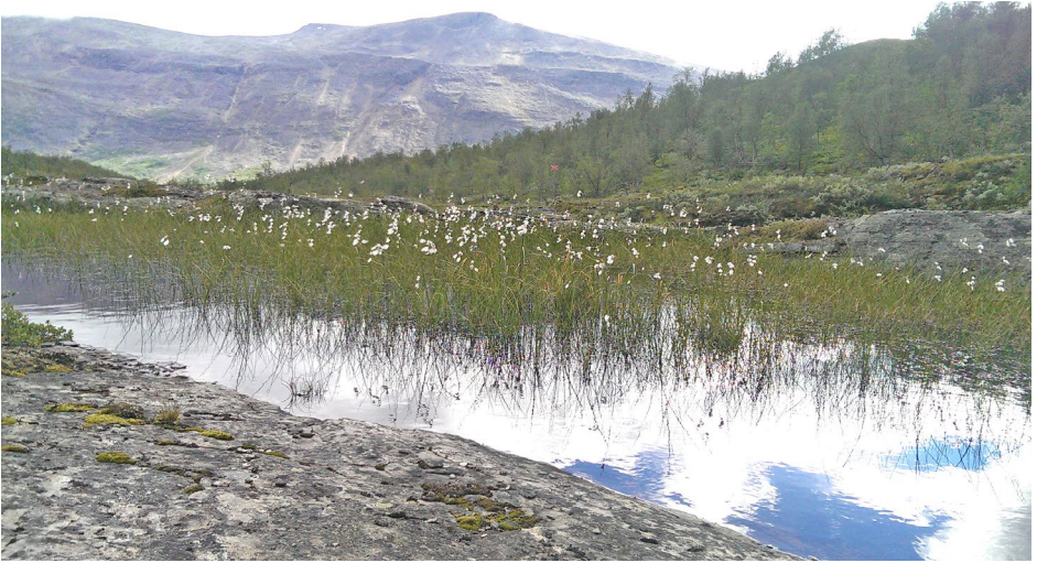
Pumpulikukka – olisiko tupasvilla? Se ainakin viihtyy tunturien rinnesoilla.

Kuin lilja kukkikoon maa, se riemuitkoon, huutakoon ääneen! – Jes. 35:1, 2