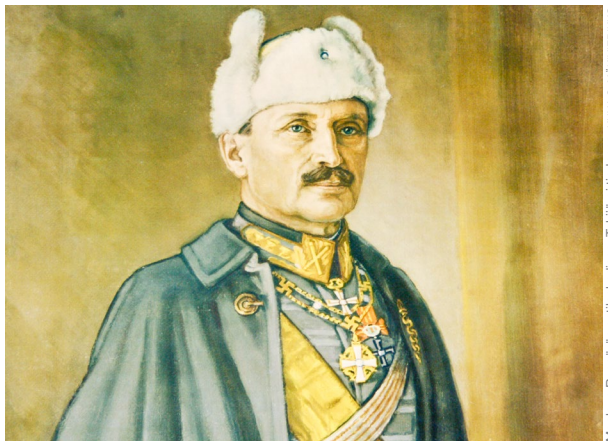
Maalaus Ruussarön sotilaskodissa. Tekijä ei tiedossa.

Kun Mannerheim haudattiin, virallista saattuetta soitto-kuntineen, armeijan edustajineen ja lukuisine ”maan ylhäisineen” seurasi katujen varsilla sankat joukot ihmisiä kaikista kansankerroksista. Jeesukselle ei pidetty hautajaisia. Epävirallisen hautaamisen toimitti muutama harva ystävä. Hallitus ja uskonnolliset johtajat loistivat poissaolollaan.