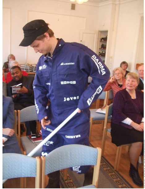
Putkinäköinen uskonpuhdistaja voi imuroida terveen uskon seurakunnasta.

Selkein merkki epäterveestä uskosta on alistaminen. Se on aina sairasta. Alistajana voi olla seurakunnan johtaja, jäsen, koko seurakunta. Se voi olla myös jokin opetus, jolla ihmisiä ahdistetaan ja jolla heiltä viedään mahdollisuus tehdä itse normaaleja elämän ratkaisuja ja käyttää aikaansa tai varojaan niin kuin itse Jumalan edessä haluavat käyttää. Oikea usko on lähtöisin Jumalasta ja tuo meidät hänen luokseen.