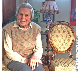
Eila opiskeli pianonsoittoa ennen kuin oppi lukemaan.

SRK:N VASTAAVA: 0176-124 05 Eeva-Liisa Vihermä SIHTEERI: 08-500 81 907 Tuulikki Hagström