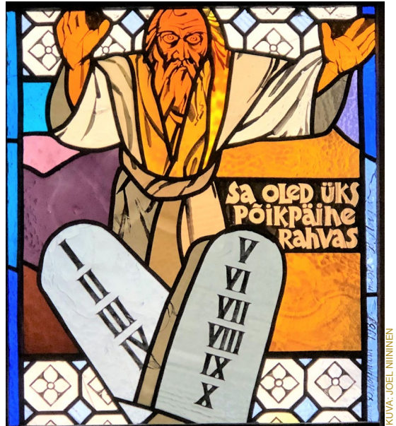
Pöikpäine, härkäpäinen kansa. Lasimaalaus Tallinnan Pyhän Hengen kirkossa.

Lähteitä: Tiina Kuokkanen: Vaatetuksen luokka ja sukupuoli 1600-1800-lukujen Oulussa (2016); Kuokkanen-Mutka-Ylimaunu: "Nappeja, solkia ja asetuksia: lainsäädännön vaikutus puukeutumiseen varhaismodernissa Oulussa", Artefactum 5, 2.2.2015; www.runeberg.org : Tietovanakirja 10 (Otava 1909-1922)/Ylellisyysasetukset; Ilta-Sanomien 15.10.2017, 20.7.2018, 22.10.2019; "Modeindustrins smutsiga baksida", SvT 21.7.2019