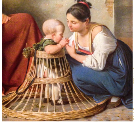
KUVA: Tanskalainen, 1800-luku?

Digiajan lapset ovat kenties kaikkien aikojen vähiten silmiin katsottu sukupolvi.